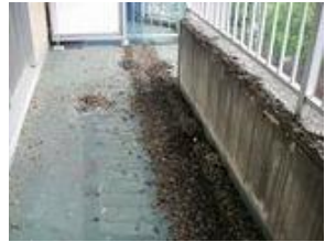
ベランダに落とされた鳩の糞害