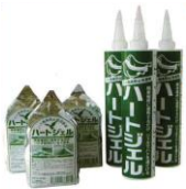
ハートジェル(忌避剤)

弊社では鳥類の防除に関しても長年のノウハウや、お客様に満足して頂いている施工実績があります。ご質問やお困りのことなどがございましたらお気軽にお尋ねください。