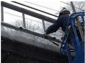
防鳩ネット設置施工

弊社へ寄せられるご相談の中には「鳥類(鳩など)の糞の被害に困っている」「鳥が巣を作ってダニが出る」「鳥が巣を作り雛鳥がいる」「鳥類がベランダの格子によく集まる」といったこともあります。