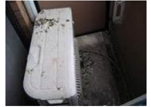
鳩の糞によるエアコンの室外機の汚染

そのため、鳩など鳥類の被害でお困りという場合は一度専門の業者に相談する方が安全であり、かつ確実に被害の解消へとつながります。