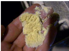
昆虫類生息の痕跡

年が明けて1カ月ほど経ちましたが、建物内の清掃はきちんと行われていますでしょうか？冬は乾燥しているため、埃やゴミなども舞いやすく、あちこちに溜まりやすくなっています。床には綿埃が見当たらなくても、空気中には浮遊塵(空気中に分散浮遊している0.1μm～10μmほどの塵や埃)がたくさん舞っているかもしれませんし、重ね着をするこの時期は更衣室などでも浮遊塵が出やすい時期でもあります。浮遊塵は徐々に沈降、または静電気により吸着、引き寄せられ、家具などに付着し、埃となります。また、虫によっては埃をエサや潜伏場所などにします。そのため、暖かくなり虫が出始める前に、発生を抑えたり、殺虫剤の効果を低下させないためにも、この時期に清掃がきちんとできているかの確認をしたりしておくことが大切です。