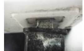
埃などが付着しているコンセント