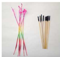
図2：線香花火の種類 左：長手牡丹 右：スポ手牡丹

まず、線香花火には2種類あるの はご存じでしょうか？よく見かけ るのは、カラフルな紙をねじった 「長手牡丹」、もう一つは藁の 先に火薬がついた「スポ手牡丹」 です。線香花火の起源はスポ手で