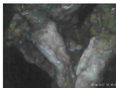
図1：汚れ付着 排水管内部に油脂 がびっちりと付着 し、排水の通り道 を邪魔しています。

新型コロナ対策で換気をしてい るところが多いと思いますが、製 造エリアやトイレなど、ふと、も わっと臭うことはありませんか？