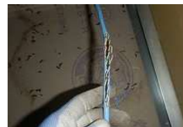
←写真：齧られて断線一步手前のLANケーブル