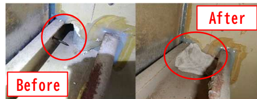
写真：齧り穴をパテで埋めた例 コーキング剤を齧って穴を作り出入りしていたが、防鼠パテで閉塞後、齧られてはいない